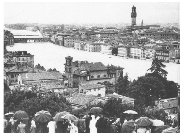
La catastrophe des inondations de Florence en 1966. Une photographie qui évoque aussi la crise du PCI en 1966 : certains membres s'arment pour continuer la lutte, mais la majorité tourne le dos, découragée.