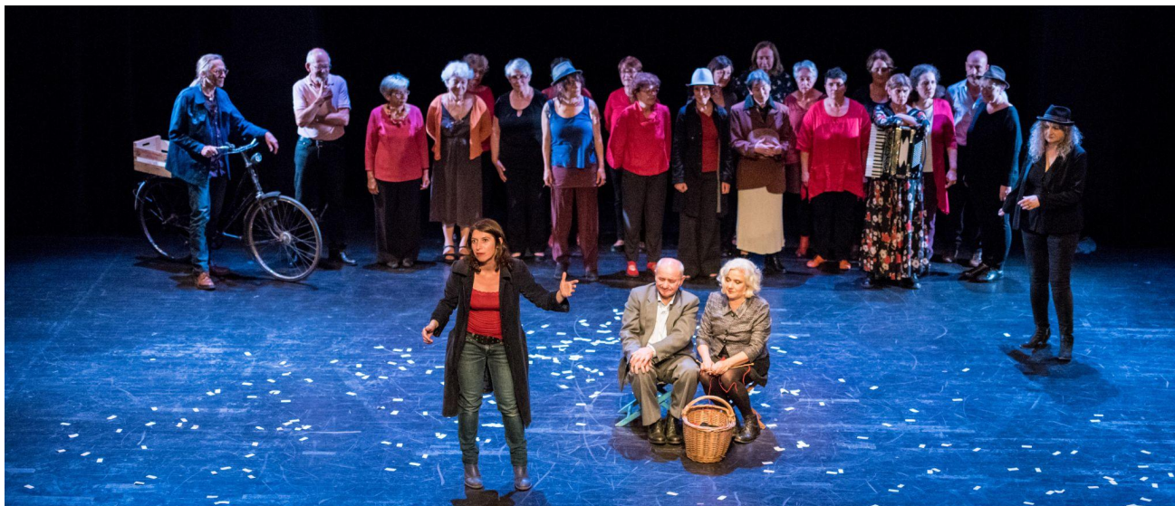
Théâtre Berthelot (Montreuil) - juin 2018

Le chœur, entité présente sur le plateau tout du long, est le peuple anonyme qui se meut, enrage, exulte face au devenir de l'homme et de sa lutte vers la justice . Au début l'espace se divise en deux zones distinctes : le chœur est une masse compacte à l'avant-scène, tandis que Henri et son épouse Alice sont en fond de scène. Ces deux zones commencent à interagir grâce aux allers-venues de la jeune montreuilloise. Le chœur représente le fond d'histoire collective sur lequel se découpent et s'ancrent ces histoires individuelles .