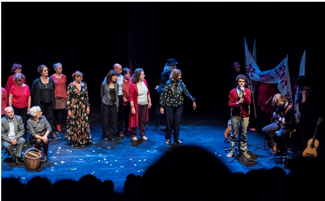
Théâtre Berthelot (Montreuil) - juin 2018

Avec cette diversité le spectacle exprime les relations du chant au politique, à la lutte, et à la communauté , en explorant un répertoire au-delà du chant de lutte.