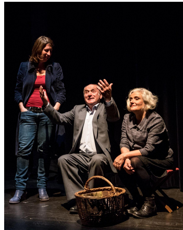
Théâtre Berthelot (Montreuil) - juin 2018

Le spectacle traite la notion de voyage non seulement au sens spatial, mais aussi au sens temporel, ou plutôt générationnel . Autant d'importance est accordée aux témoignages des descendant-e-s de ces activistes, leurs enfants et petits-enfants, pour comprendre ce qui transite entre les générations d'un engagement politique si fort . De quelle orientation politique, de quelle attitude sociétale auront-ils, auront-elles hérité ?