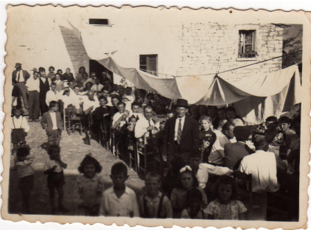
vers 1930, Porte de Bagnolet. Les immigré-e-s italien-ne-s s'étaient installé-e-s dans la Zone de non Fortification (actuel Périphérique de Paris), devenu plus tard le refuge des résistant-e-s.