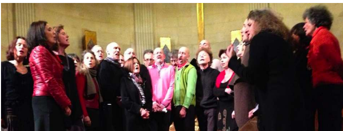
Chœur "Chants de L'Emigration"

Il a repris les études de musique et joue également du trombone.